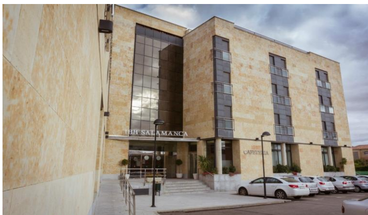
HOTEL IBB RECOLETOS COCO Av. Agustinos Recoletos, 44. Salamanca. (923/22-65-00)

Los precios son por persona y día, con IVA Incluido.