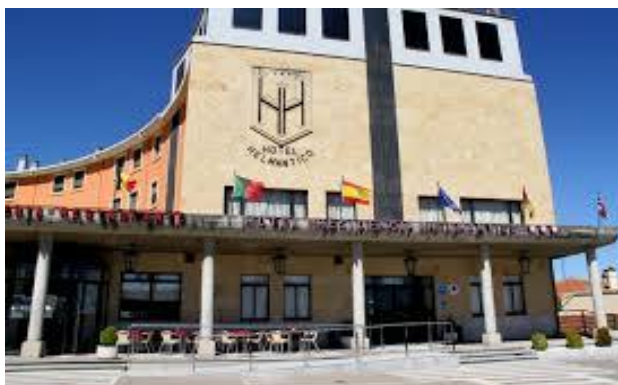
HOTEL EL HELMÁNTICO Ctra. Zamora, Km. 1. Salamanca. (923/22-12-20)

Los precios son por habitación, con IVA Incluido.